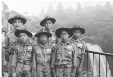
現在掲示している写真です