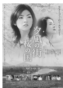
『夕風の街 桜の国』 2007年 監督:佐々部 清 原作: ころの中代(双葉社)