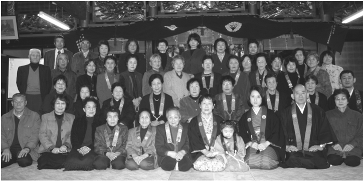
今年の十六日御命日にお参りされた皆さん

十五日には、夜の座の後に午後十一時の通夜法座もあります(平成六年までは、十六日朝五時のお朝事まで、徹夜でお番をするお通夜を、極楽寺でも勤めていました。)十六日の御命日は、特に大切に勤めいたします。十六日には、毎年記念写真を撮ります。