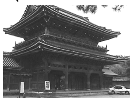
瑞泉寺は、真宗大谷派の別院。彫り物で、大変有名です。