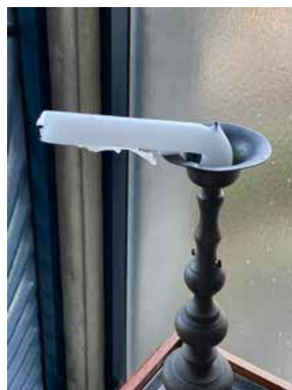
納骨堂のろうそくが、厳しい日差して、こんなことになってしまいました。